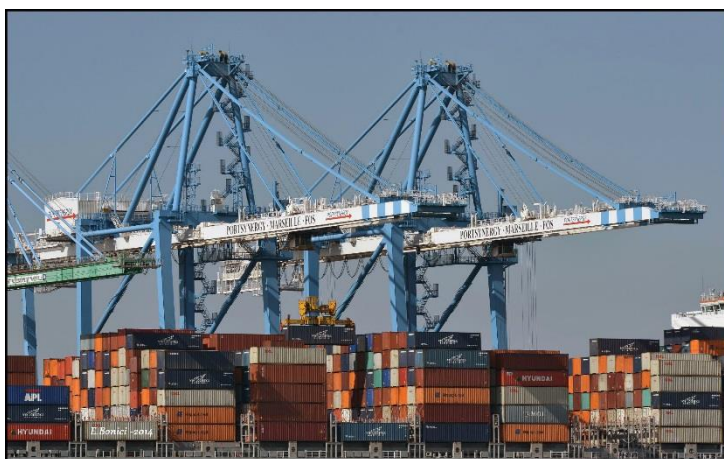
The new Quay Cranes will be 33% higher than those in the picture

According to Nicolas Gauthier, CEO "by means of its massive investment, the company PortSynergy / Eurofos contributes to the modernization and development of the port of Fos-Sur-Mer , and beyond, to the recovery of the French economy ".